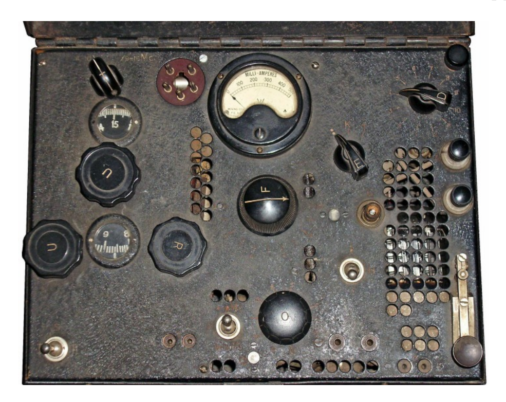
BP 4 Country of origin: Polish in England