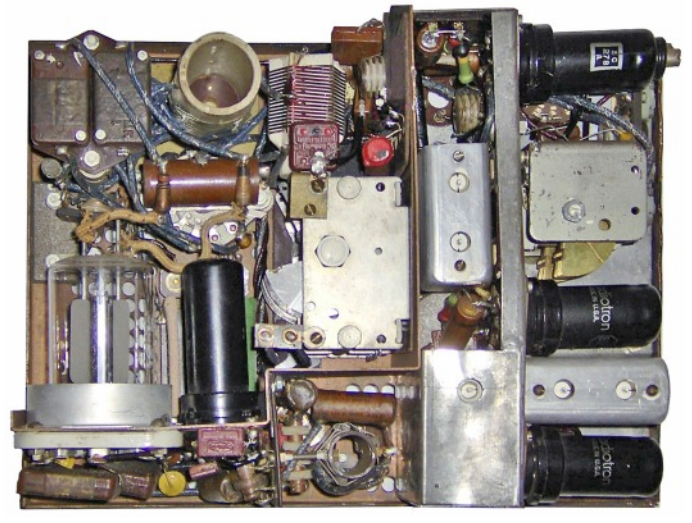
Bottom view of BP 4: receiver components right and transmitter left. The RF output valve is not an original type 829 but a later commercial version. (A new photo with a correct valve is in preparation)

The Polish BP 4 was based on the BP 3, with physical similar dimensions and appearance, but with a different frequency coverage. At a glance the BP 4 could be recognised by two receiver tuning windows which was caused by the different construction of the mixer circuit. Whereas the BP 3 and BP 5 had a local oscillator operating on one band, using upper and lower mixing, the BP 4 had two switched oscillator bands.